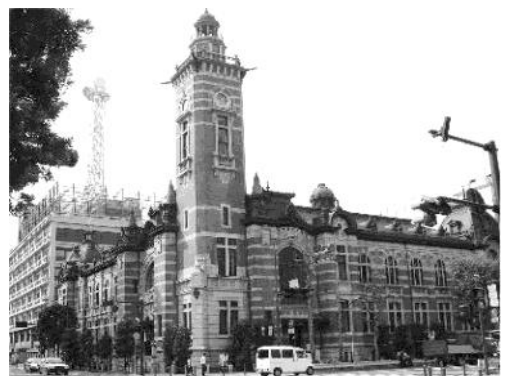
会場の横浜開校記念会館